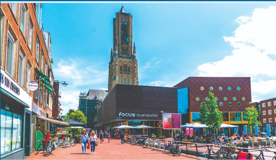
Ένας από τους χώρους της έκθεσης στο κέντρο του Άρνεμ, υπό τη σκιά της εκκλησίας του Αγίου Ευσεβίου

«Αυτός ήταν ο ήχος της δουλειάς. Μπορείτε να μας πάρετε τα πάντα, αλλά όχι την ανθρωπιά μας. Μπορείτε να μας πάρετε τα πάντα, αλλά όχι τη χαρά μας. Τη μαύρη χαρά». Στο σημείο αυτό, μία μέρα πριν από την επίσημη έναρξη, θα μπορούσαμε ακόμα και να λήξουμε τη διοργάνωση κατά τα λεγόμενά του, αφού η περφόρμανς είχε ζωντανέψει την ουσία της, δηλαδή το βίωμα της μαύρης υπόστασης μέσω του ήχου. Ευτυχώς για εμάς, το πρόγραμμα συνεχίστηκε σε ανάλογους ρυθμούς για να πάρουμε μια καλύτερη γεύση από τα ηχοτοπία του οικοσυστήματος, όπως έγινε κατά τη βραδινή μας μυσταγωγία στην επιβλητική εκκλησία του Αγίου Ευσεβίου, όταν η γνωστή DJ Lynnée Denise φρόντισε να μας υπενθυμίσει πως η techno μουσική έχει γίνει με το ζόρι κτήμα των λευκών της Κεντρικής και Βόρειας Ευρώπης. Πατρίδα της είναι στην πραγματικότητα οι μαύρες γειτονιές του Νιπρόιτ, απ' όπου προέρχεται και το ντουέτο των Drexciya που παίζει στην κονσόλα της. Για τους αμφισβητίες, το κομμάτι οραματίζεται τη ζωή μετά θάνατον των βρεφών που γεννιούνται στον πάτο της θάλασσας από σκλάβες εγκύους.