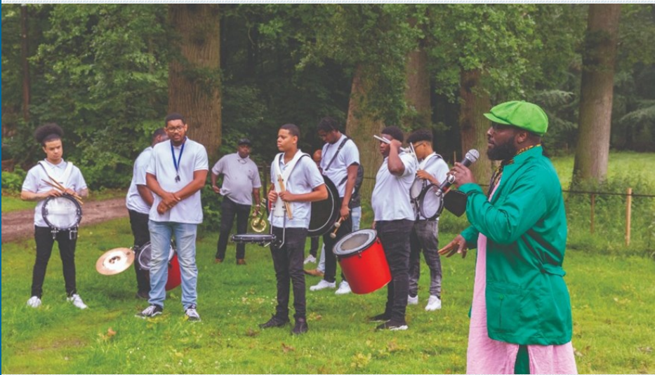
Ο καλλιτεχνικός διευθυντής Bonaventure Soh Bejeng Ndikung μας παρασύρει με το πάθος του

Sonsbeek. Μπροστά στις επιβλητικές σημαίες της Shahtroudi ο Ndikung πήρε το λόγο, φέρνοντας στο επίκεντρο ένα ζήτημα που συχνά ξεχνιέται μπροστά στο μαρτύριο του μαύρου τραύματος: τον εορτασμό και την απόλαυση της ζωής.