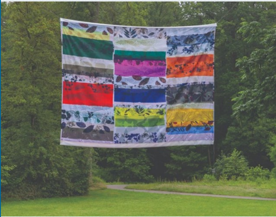
Τα οικολογικά τυπώματα της Jennifer Tee μιλούν με το πάρκο Sonsbeek

πόλης, καθώς και στο μουσείο Kröller-Müller . Περιλαμβάνουν από γλυπτά, μέχρι ραδιοφωνικές εκπομπές, εκδόσεις, ομιλίες και περφόρμανς, και θα συνεχίσουν σε πιο σποραδικούς ρυθμούς για τα επόμενα χρόνια, με στόχο να αφήσουν για τα καλά το αποτύπωμά τους τόσο στους ντόπιους όσο και σε όσους τουρίστες βρεθούν στο Άρνεμ.