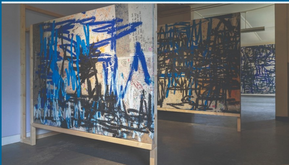
Τα μουτζουρωμένα θρανία του Oscar Murillo θα μπορούσαν να ανήκουν σε κάθε σχολείο, όπως και οι εμπειρίες που τα σημάδεψαν

δική μας προσεκτική εμβάθυνση στο να πλησιάσουμε, να συνομιλήσουμε και να αφουγκραστούμε κάθε έργο. Όσο οι ξένοι συνάδελφοί μου αναλύουν τις συζητήσεις που έχουν ανοίξει για το αποικιοκρατικό παρελθόν στις χώρες τους, ως απόηχος του κινήματος #BlackLivesMatter, αναρωτιέμαι πόσο τελικά απέχει από το δικό μας βίωμα, σε μια χώρα που για να μιλήσει για αποικιοκρατία ως θύτης πρέπει να στραφεί στο απώτερο παρελθόν της, ενώ στο πιο πρόσφατο ανήκει κυρίως με τα θύματα. Η κουβέντα που ανοίγει το Sonsbeek ευνοεί αυτούς τους προβληματισμούς, αφού δεν εξαντλείται στο παρελθόν των φυτειών, αλλά φτάνει μέχρι τη σύγχρονη δουλειά του καπιταλιστικού εργασιακού περιβάλλοντος, δίνοντας φωνή στους ίδιους τους εργατές (εκτός από τους καλλιτέχνες) του φεστιβάλ. Ακόμα κι αν οι φρικαλεότητες του Λεοπόλδου Β' στο Κονγκό, που σπικτοποιούνται στο έργο του visual artist Ndidi Dike «A bend in the river II», απέχουν από τη σύγχρονη βιαιότητα της εργασιακής ανασφάλειας, το στρες που μας δημιουργούν τα άρρυθμα ρολόγια του Leo Asemota («Third Permutation: "how-long-and-how-hard-and-how-fat"»), πάνω από τη ρεσεψιόν που μετρά τα ωράρια υπαλλήλων και επισκεπτών στο μουσείο Kröller-Müller, ξεκαθαρίζει γρήγορα πως ο πληρωμένος χρόνος καταναγκασμού εγγράφεται στον ψυχισμό μας μέχρι σήμερα.