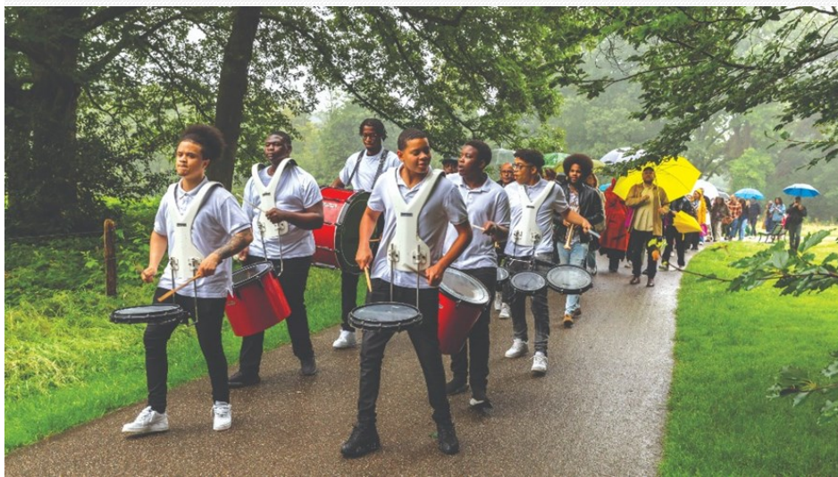
Η μπάντα Ritmo γιορτάζει την κατάργηση της δουλείας

Στο σβήσιμο του Ιουνίου, απογειωθήκαμε από μια Αθήνα που έβραζε για να προσγειωθούμε στο βροχερό (και πολύ πιο κρύο) Άμστερνταμ , με στόχο να